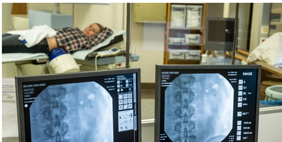
▲ Het ESWL-toestel tijdens een ambulante procedure onder lokale anesthesie.

Omdat nieuwe technieken elkaar snel opvolgen en legio voordelen voor de patiënt opleveren, volgen de urologen technologische innovaties op de voet. Enkel de beproefde technologieën zijn goed genoeg voor hun patiënten. Daarom is robotchirurgie voor deze specialisatie niet meer weg te denken. In de prostaatkliniek alleen al zijn sinds 2006 meer dan 3.500 patiënten met gelokaliseerde prostaatkanker geopereerd met behulp daarvan. De artsen zijn dankbare gebruikers van het nieuwste da Vinci Xi-robotsysteem waarover campus Sint-Jan sinds 2018 beschikt, omdat het aanzienlijke voordelen biedt voor de patiënt: kortere verblijfsduur, minder ongemakken voor en na de operatie en minder risico op complicaties of hervat. Noem het gerust hun kroonjuweel.