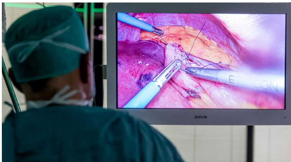
Het Centrum voor Obesitaschirurgie behaalt uitstekende klinische resultaten: de conversie van 885 patiënten van de maagband naar de bypass toont een 30-dagen complicatieratio van slechts 5,1 % en uit een retrospectieve studie van de eerste 10.000 gastric bypasses die zijn uitgevoerd kwamen slechts zeven lekkages en een belangrijke daling in zowel postoperatieve bloeding als heroperatie voor postoperatieve bloeding naar voor.

Een aandachtspunt is de bestudering en de bekendmaking van de prima klinische resultaten van het centrum in wetenschappelijke tijdschriften. Een publicatie over de conversie van 885 patiënten van de maagband naar de bypass op campus Sint-Jan beschrijft de resultaten van deze omzettingsoperatie en vertegenwoordigt het hoogste aantal patiënten wereldwijd met een dergelijke revisionele ingreep. Uit deze studie blijkt een lage 30-dagen complicatieratio (5,1 %) die gelijklopend is met de ratio van complicaties bij patiënten die voor de eerste maal een gastric bypass ondergaan. Een andere studie evalueert de eerste 10.000 gastric bypasses die op campus Sint-Jan zijn uitgevoerd van 2004 tot 2016. De uitstekende resultaten tonen slechts zeven lekkages waarvan het merendeel (5) in de eerste cohorte van 2000 patiënten. Verspreid over de jaren werd tevens een belangrijke daling in postoperatieve bloeding (van 3 % tot 0,7 %) en van een heroperatie voor postoperatieve bloeding (1 % tot 0,1 %) vastgesteld. Andere, meer specifieke studies oriënteren zich op de chirurgische mogelijkheden indien er alsnog een gewichtstoename of een complicatie optreedt na een gastric bypass of sleeve gastrectomie.