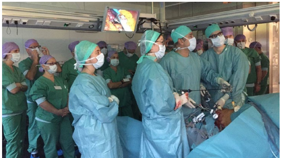
Gespecialiseerde chirurgen van over de hele wereld vinden hun weg naar het Centrum voor Obesitaschirurgie voor een week observatie of een klinisch fellowship.

gedetailleerde videotoegang tot de drie operatiezalen en kan hij desgewenst elke operationele ingreep zowel laparoscopisch als extern superviseren.