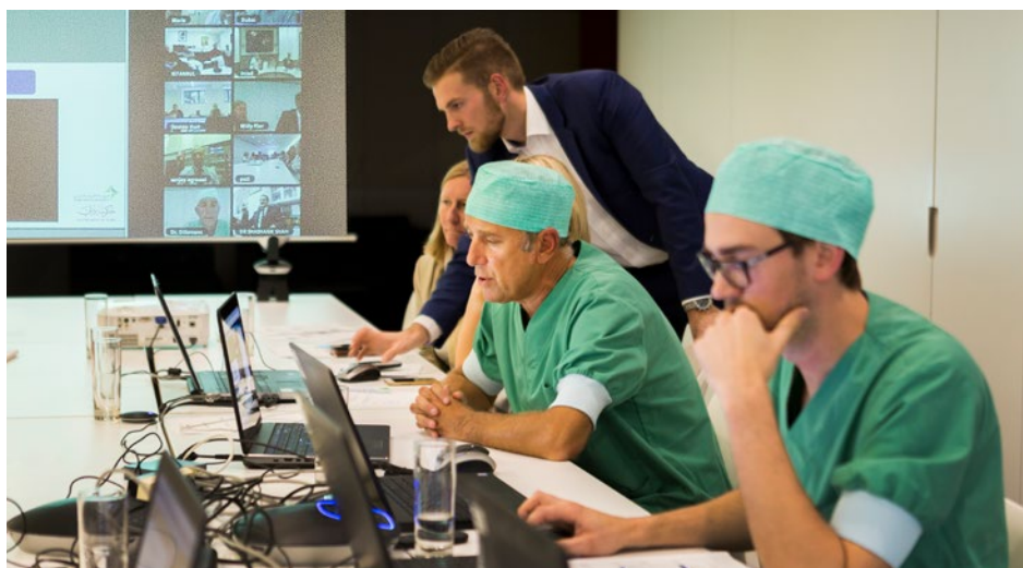
Via het interactieve webplatform BARIAlink kunnen bariatrisch-chirurgische experts op hoog professioneel niveau hun kennis en knowhow delen, op diagnostische en therapeutisch vlak, maar ook met betrekking tot complicaties.