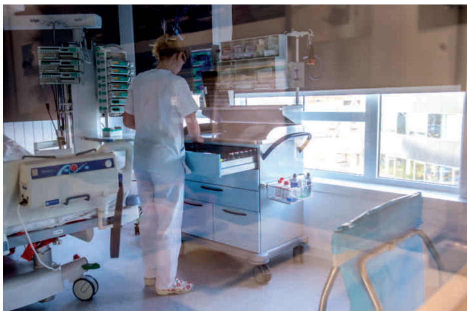
Twee isolatieboxen met toegangssluis en een aangepast over- en onderdrukstelsel beschermen patiënten wiens immuniteit gecompromitteerd is tegen schadelijke invloeden van buitenaf.

Alle 24 verpleegkundigen zijn 'Banaba' (Bachelor-na-Bachelor)-gediplomeerd. Bij het betrokken personeel gaat veel aandacht naar bijscholing, opvolging van de literatuur en de toepassing van internationale, evidence-based richtlijnen op basis van concreet opgestelde protocollen. Een delegatie verpleegkundigen woont getrouw het jaarlijkse Venticare congres en de minicongressen van de Vlaamse Vereniging voor Intensieve Zorgen Verpleegkundigen bij, en op het International Symposium on Intensive Care and Emergency Medicine in Brussel gaan de intensivisten steevast hun medische bagage actualiseren. De vergaarde kennis en kunde worden onderling doorgegeven en viermaal per jaar bijgespijkerd voor het hele team tijdens de algemene dienstvergaderingen.