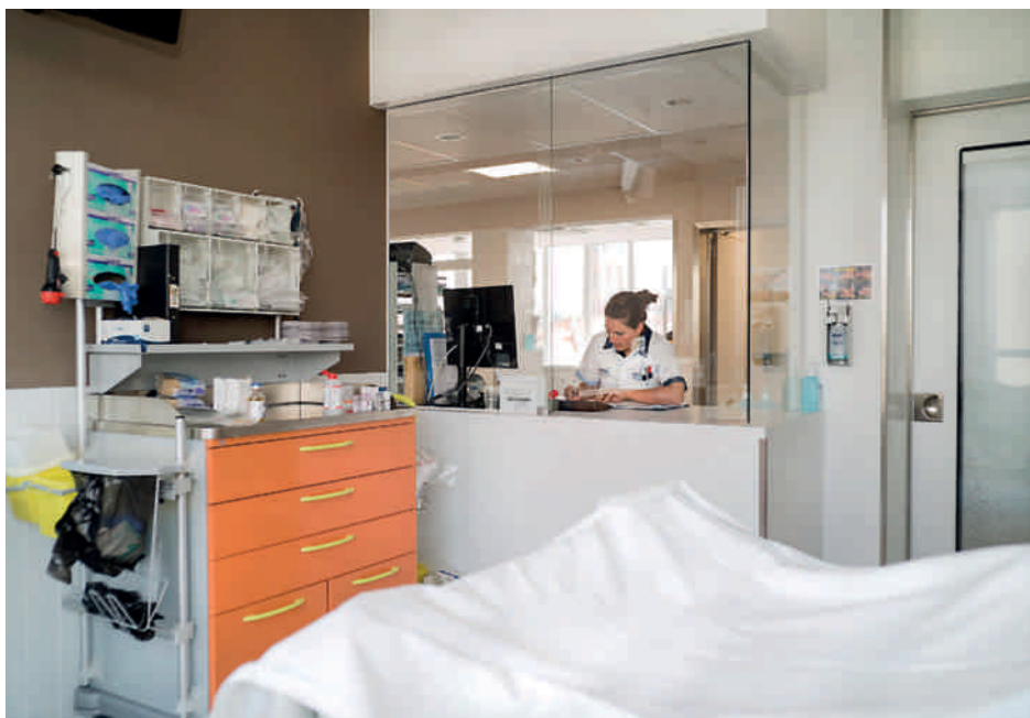
De openschuifbare glazen wand tussen de werkbladen en de kamers biedt de mogelijkheid tot observatie van en communicatie met de patiënt zonder diens privacy continu te storen.

De dienst Intensieve Zorgen kent een bezettingsgraad van 80%. Ongeveer 60% van de patiënten komen van de afdeling chirurgie, hoofdzakelijk vanuit de diensten Algemene Heelkunde en Neurochirurgie. Zo'n 40% zijn patiënten uit internistische diensten zoals Oncologie en Pneumologie. Vier intensivisten ontfermen zich over patiënten uit alle disciplines, op Pediatrie en Cardiochirurgie na. Hun multidisciplinaire aanpak vergt een hechte samenwerking met nagenoeg alle andere diensten binnen het ziekenhuis. Ook met campus Sint-Jan zijn er goede samenwerkingsverbanden. Beide Intensieve Zorgen diensten vormen elkaars buffer bij plaatsgebrek en er is een vlot doorverwijzingssysteem voor de patiënten die nood hebben aan hartkatheterisatie, ECMO (Extra Corporele Membraan Oxygenatie), cardiochirurgie of chronische dialyse.