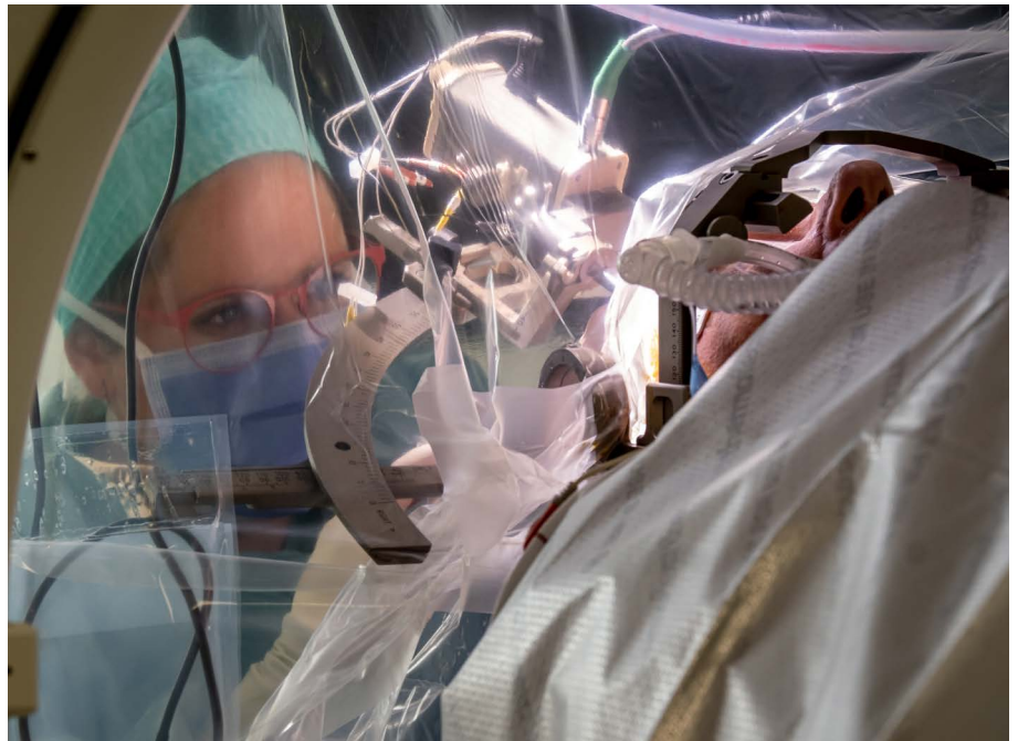
▲ Terwijl de patiënt slaapt, volgt de verpleegkundige aandachtig de testprocedure.

Bij deze laatste groep patiënten speelt het programmeertoestel waarmee de patiënt de stimulatie zelf aan en uit kan zetten of bijregelen al meteen een belangrijke rol in het voorkomen van gewenning en vermindering van het effect op de tremor. Al krijgen de andere DBS-patiënten net zo goed zo'n patient programmer mee naar huis. Dit apparaat in de vorm van een smartphone is gelinkt aan de stimulatielektrode(n) in de hersenen en geeft de patiënt binnen bepaalde veilige grenzen controle over de stimulatiesterkte. De bepaling van die grenzen en de eerste afstellingen gebeuren steeds in nauwe samenspraak met de artsen en de parkinsonverpleegkundigen, Nanou Winter (campus Sint-Jan) en Tania Lamote (AZ Sint-Lucas). Het multidisciplinaire