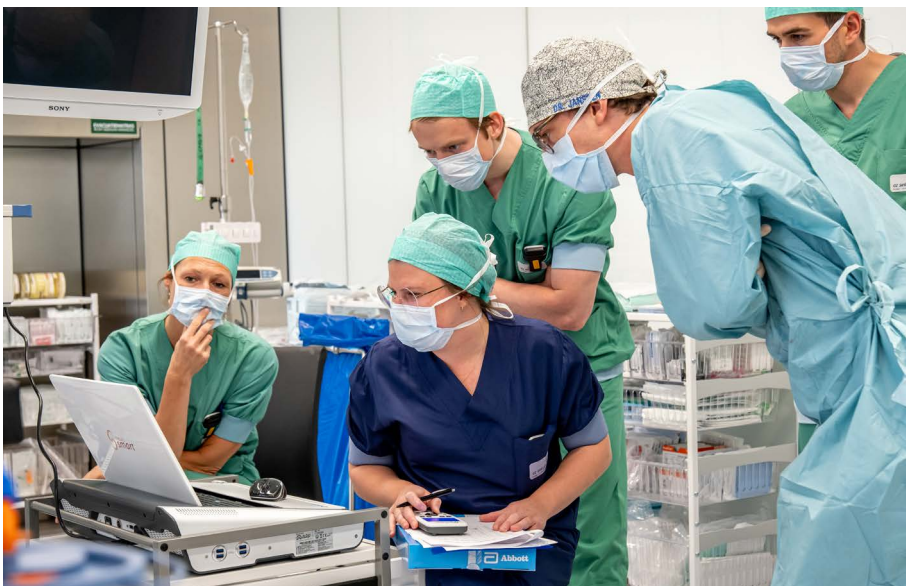
▲ Interpretatie van de MER-signalen.