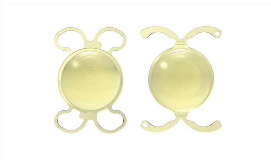
▲ Voorbeeld van multifocale lens